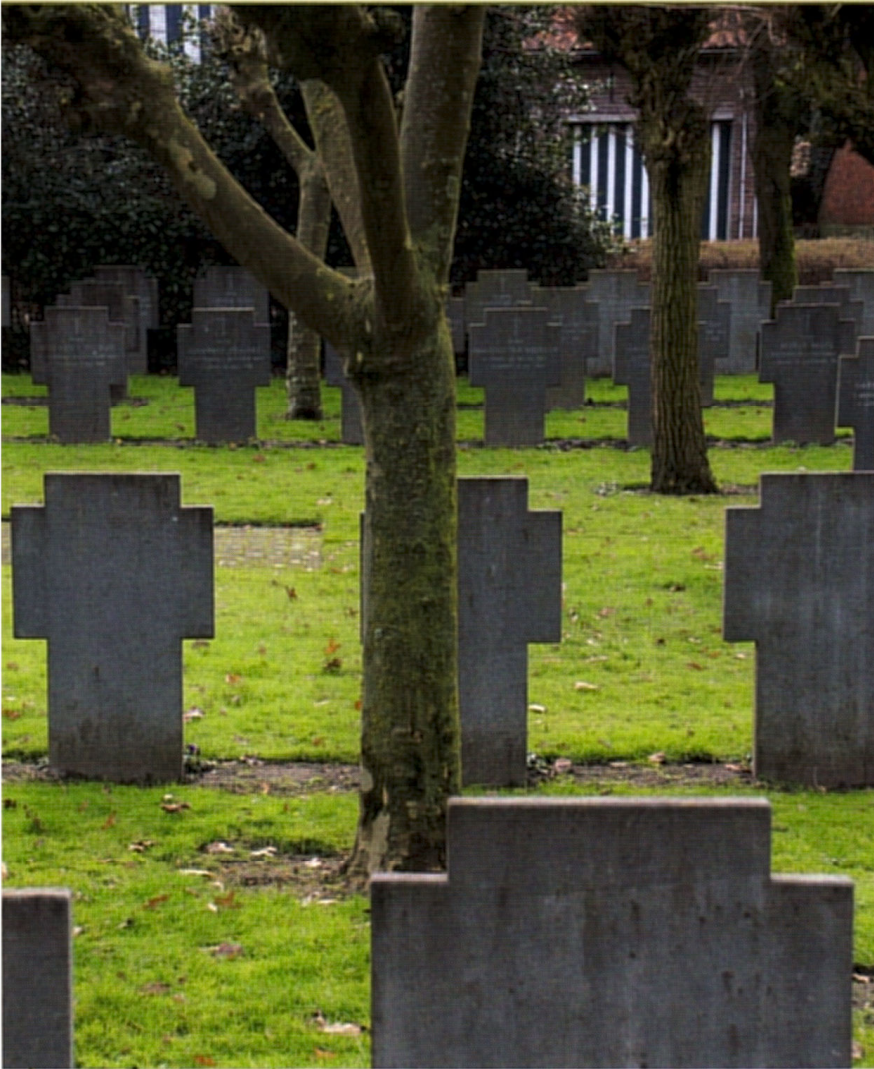
De begraafplaats van de Priesters van het H. Hart achter het klooster in Asten.