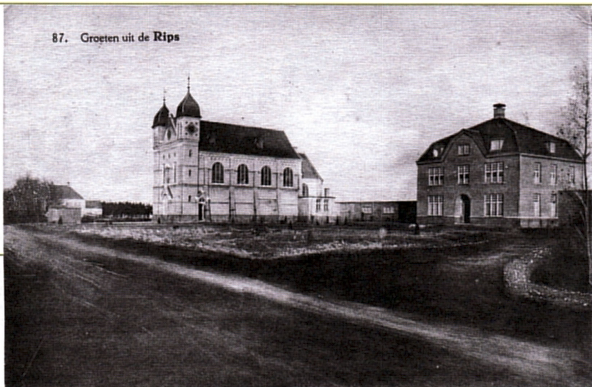
87. Groeten uit de Rips