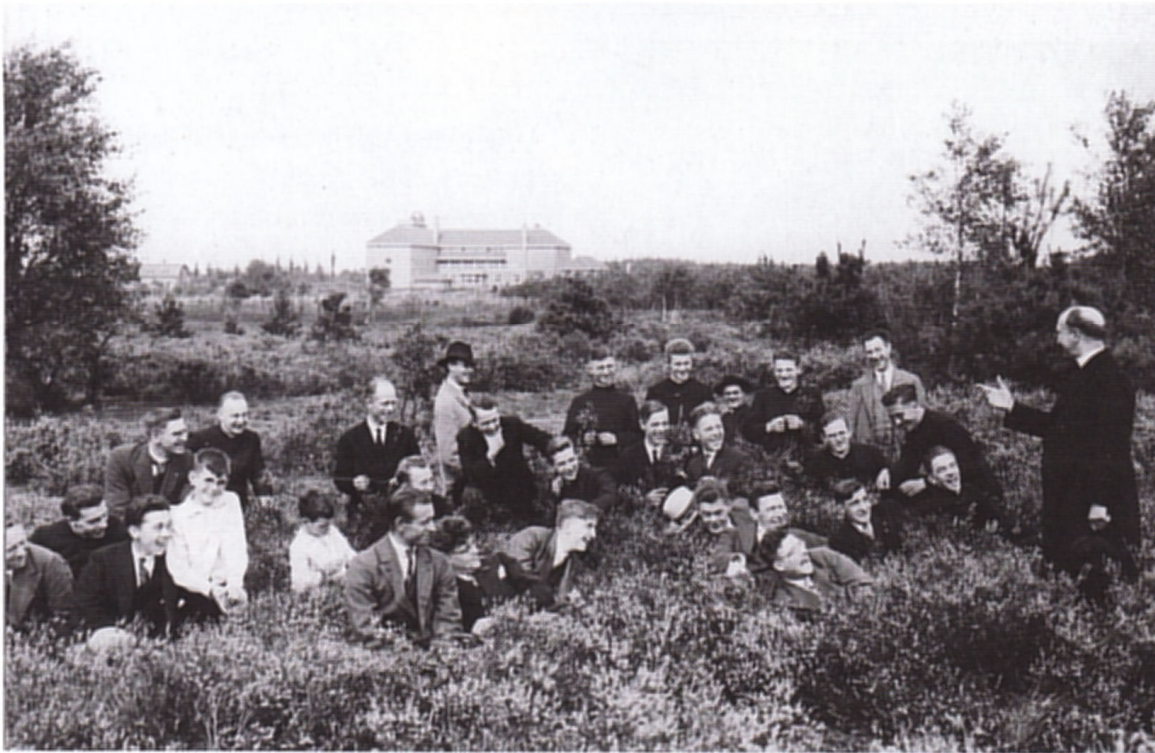
Leerlingen, fraters en paters genieten van de buitenlucht. Op de achtergrond is het missiehuis te zien.