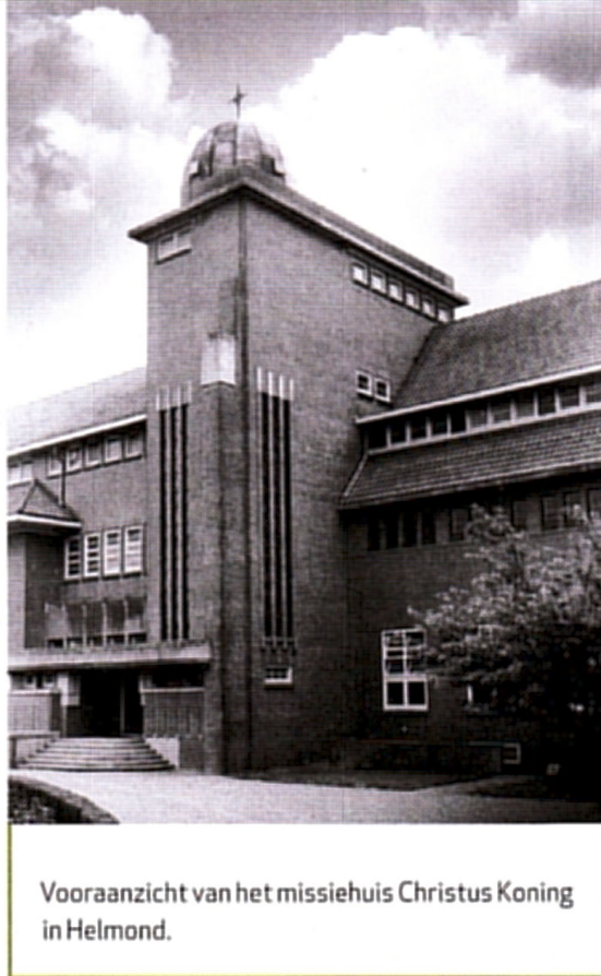
Voorraanzicht van het missiehuis Christus Koning in Helmond.

brek aan andere verenigingen en concurrerende stromingen – hele groepen dorpingen tegelijk lid werden: de Broederschap van de Heilige Familie, de Mariacongregatie, het Genootschap voor de Voortplanting des Geloofs en dat van de H. Kindsheid. De laatste twee genootschappen waren specifiek op de missie gericht, de andere op bevordering van de vroomheid in het algemeen. De verenigingen waren vooral bedoeld om de parochianen sterker aan de kerk en hun parochie te binden. Daartoe organiseerden de paters niet alleen godsdienstige gezelschappen, maar ook meer wereldse clubs en verenigingen die gericht waren op cultuur, sport of arbeid. Zo kleurde het hele leven katholiek. In de crisisjaren sprongen de SCJ'ers regelmatig bij wanneer dorpingen het financieel echt niet meer konden bolwerken.